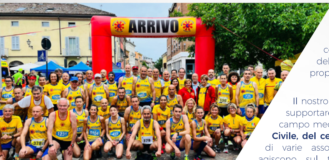
gruppo podistico Atletica Casone