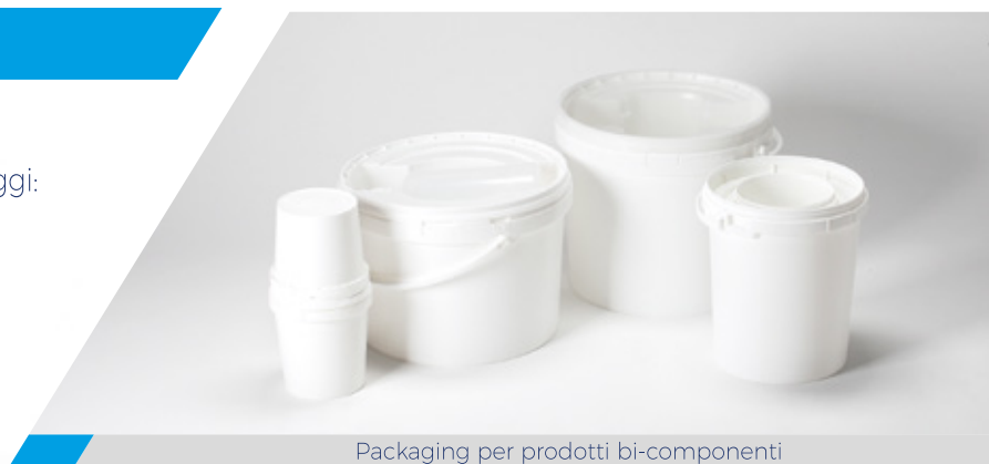
Packaging per prodotti bi-componenti