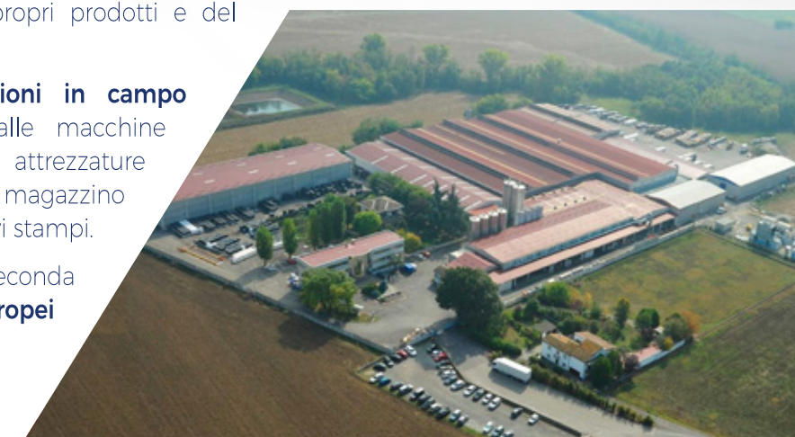
vista aerea stabilimento

Oggi l'azienda viene gestita dalla prima e dalla seconda generazione, vende in tutti i principali paesi europei ed extraeuropei e conta 150 collaboratori .