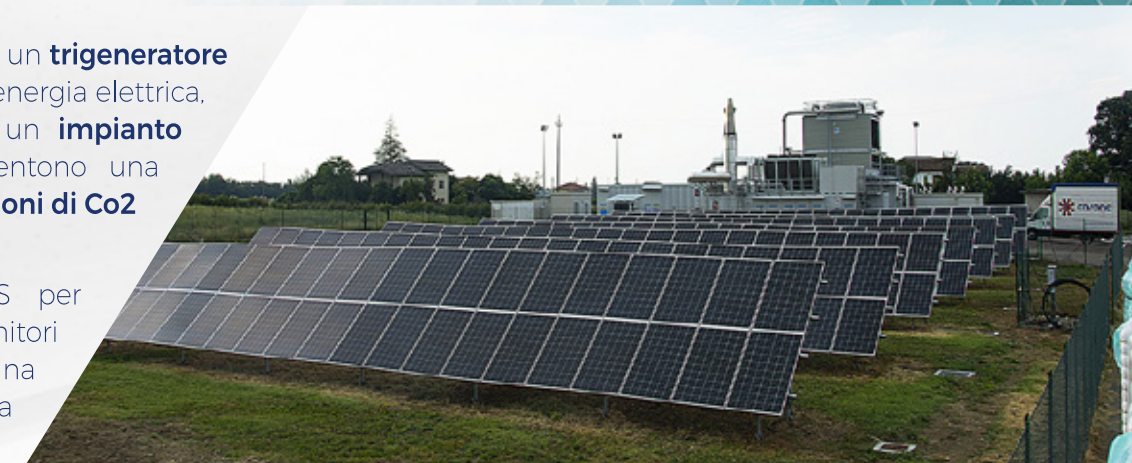
impianto fotovoltaico e trigeneratore