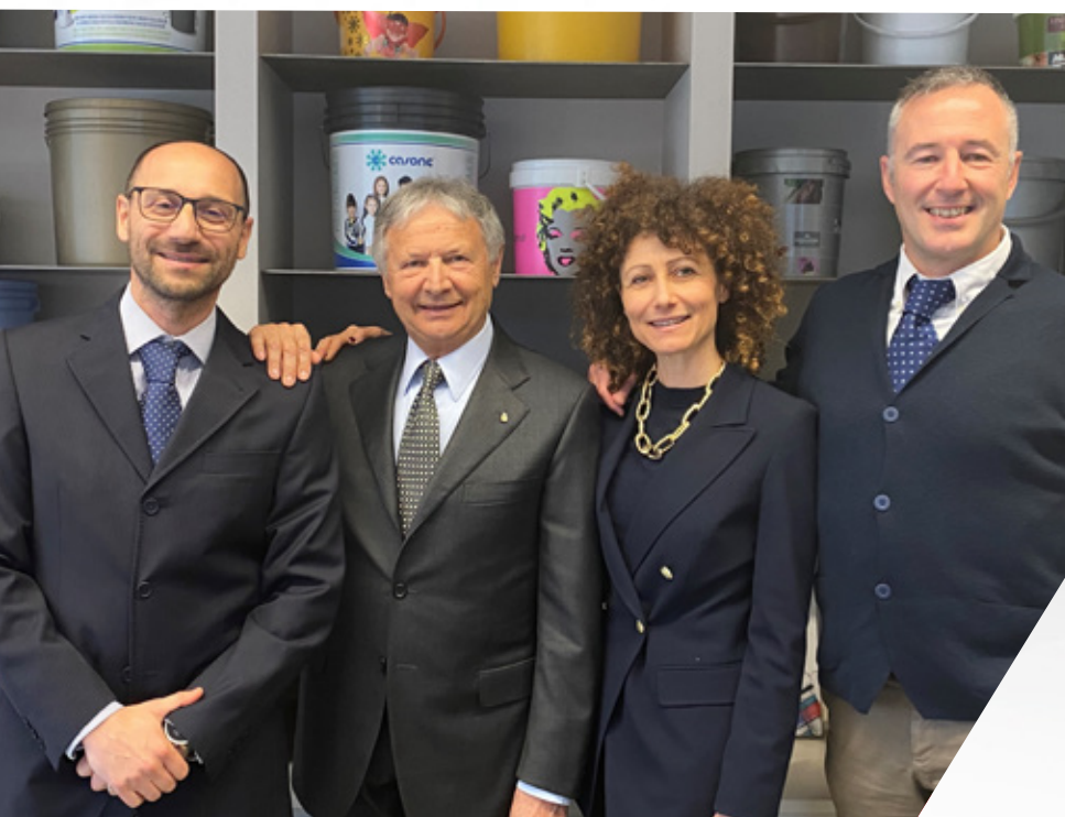
CDA Casone S.P.A.

Il nostro impegno quotidiano è da sempre focalizzato sull'alta qualità e le eccellenti prestazioni dei nostri contenitori. I nostri imballaggi sono robusti e garantiscono ottime performances sia in accatastamento statico che dinamico. Vogliamo concorrere al successo dei nostri clienti offrendo loro un servizio flessibile, rapido e personalizzato . Tutto ciò senza dimenticare i valori di Etica Aziendale e Responsabilità Sociale che guidano tutte le nostre scelte.